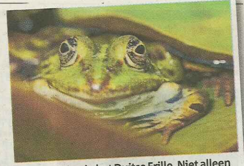
Een kikker in het Duitse Frille. Niet alleen bossen en parken leveren in de herfst mooie plaatjes op, ook aan de waterkant zijn die te schieten.

Vandaag is het eerst wisselend bewolkt, al kunnen er in de ochtend wel lage wolkenvelden voorkomen. Tijdens de voormiddag kan er lokaal zelfs een buitje vallen. Na de middag is het overal zo goed als droog met opklaringen, maar gaandeweg komt er vanuit het westen alweer meer bewolking opzetten. De maxima liggen rond 15°C.