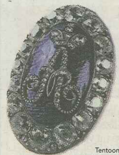
Tentoonstelling 'Aan het Russische Hof', Hermitage Amsterdam.

In 2009 is Amsterdam een Art City. Kijk voor meer informatie en arrangementen op www.amsterdamartcity.nl