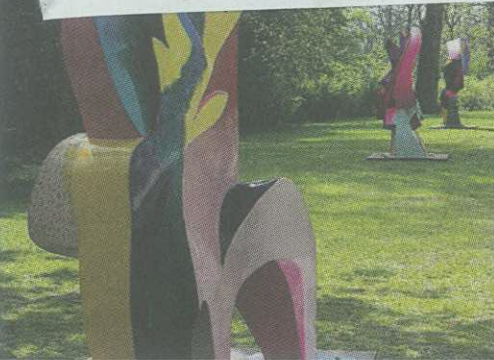
Christobal Gabarron (Spanje): 'The mysteries of Columbus I-X' in het Vondelpark