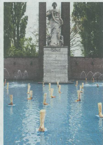
Ai Wei Wei en de Vietnamese Dinh Q. Lê. Ze hebben immers allemaal een verhaal te vertellen!" (CP)