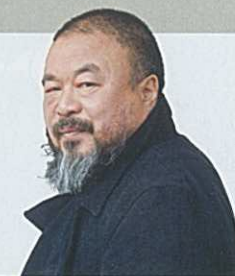
De Chinese kunstenaar en dissident Ai Weiwei.

Vanaf dit openluchtmuseum stappen we met onze kinderen aan boord van de Soren Larsen,