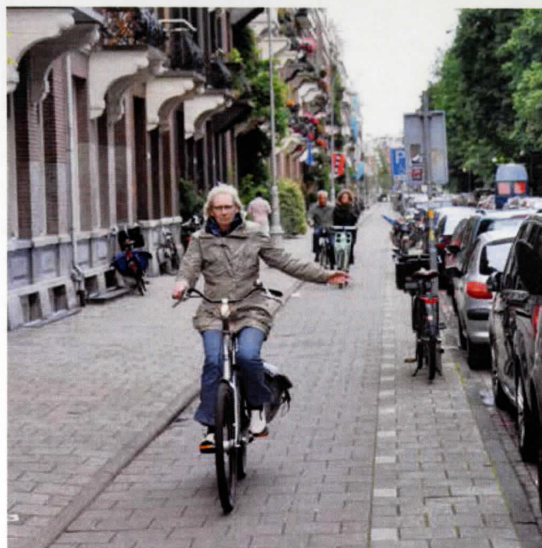
Wordt vrijliggend fietspad opgeofferd aan parkeerplaatsen voor auto's?