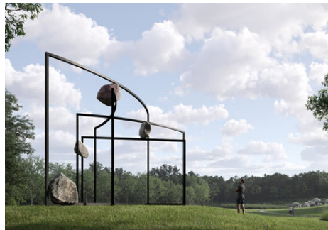
Alicja Kwade MatterMotion, 2023