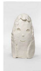
Yoshitomo Nara Long Tall Peace Sister, 2024