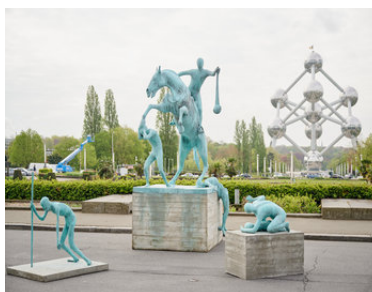
Atelier Van Lieshout The Monument Group, 2015