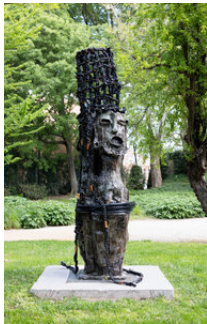
Leilah Babirye Inhebantu from the Kuchu Eastern Busoga Kingdom, 2023/2024